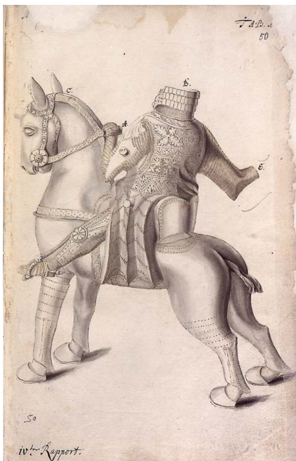
Рис. 2. Неизвестный художник. Бронзовый аквамил в виде конного рыцаря. Хильдесхайм, Нижняя Саксония. Около 1200 г. или начало XIII в. ©Санкт-Петербургский филиал Архива РАН. Ф. 98. Оп. 1. Д. 20. Л. 50.